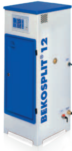
Allgemeine bauaufsichtliche Zulassung Z-83.5-9 Deutsches Institut für Bautechnik, Berlin